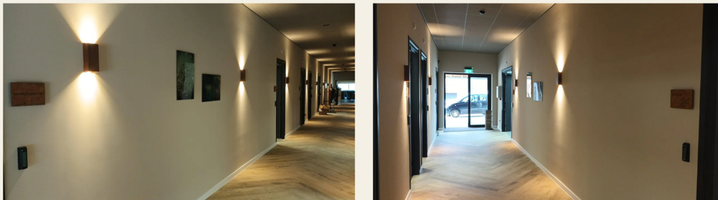
De Stardust-serie geplaatst in de gang bij de verzorgingskamers van Hoeve De Zwingel.

Vanaf 21 maart 2026 zijn twee werken uit de Stardust-serie opgenomen in de permanente collectie van Hoeve De Zwingel in Nederweert. In een ruimte gewijd aan afscheid en herinnering vormen deze werken een brug tussen verlies en het eeuwige licht dat we allemaal in ons dragen.